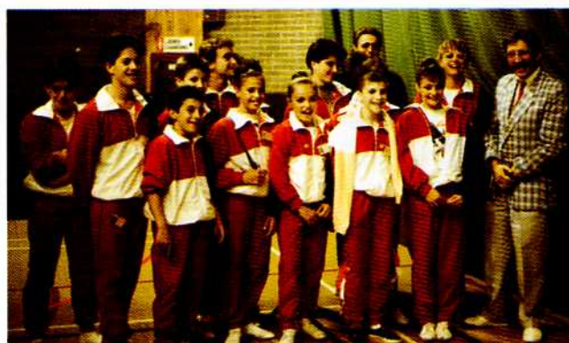
La délégation Française