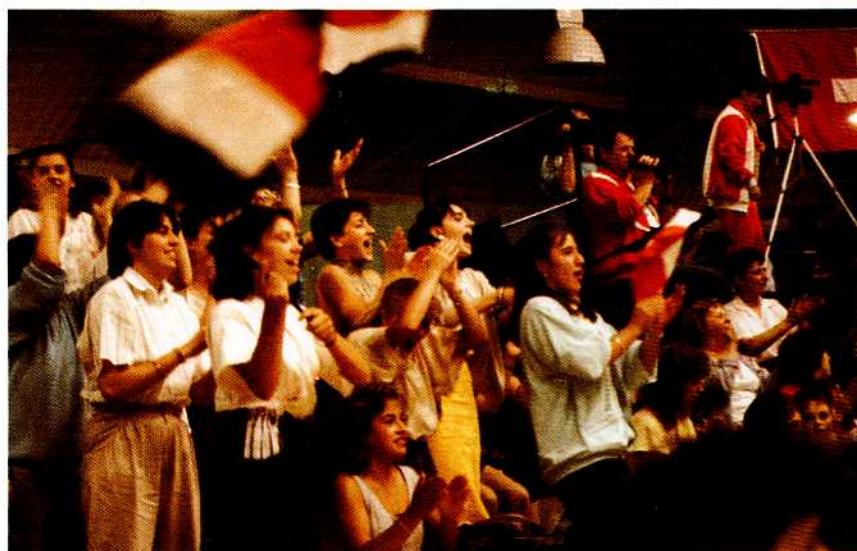
Les supporters Français