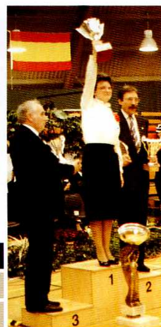
Le combiné: La France sur la deuxième marche